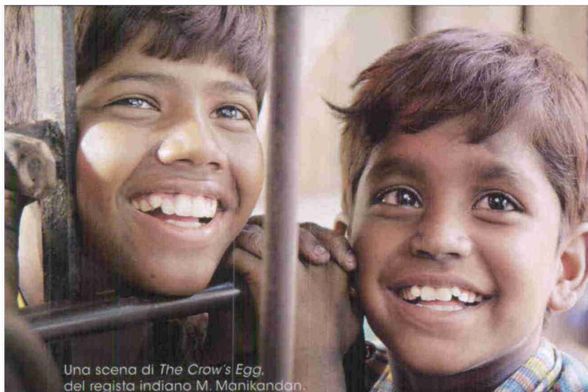
Una scena di The Crow's Egg , del regista indiano M. Manikandan.